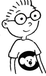
Üşengeç ben Sessiz Sakin