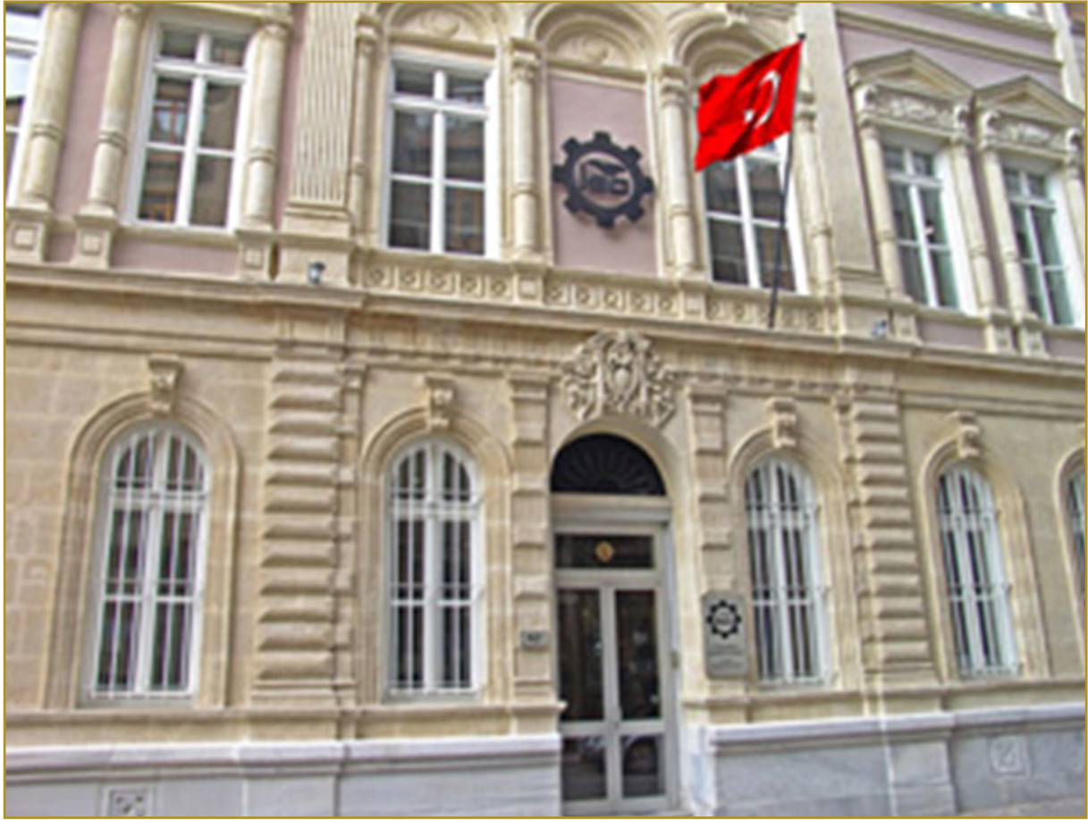
İSO tarihi merkez yönetim binası

1950’li yıllarda İstanbul’da emek yoğun ve küçük ölçekli imalat yatırımlarıyla birlikte, büyük özel yatırım şirketlerinin oluşturduğu yeni bir kuşak ortaya çıkmıştır. Sanayiciler işe küçük atölyelerde başlamışlar ve dönemin imkânsızlıklarına rağmen sanayileşmede önemli başarılarla imza atmışlardır. 1950 sonrasında, İstanbul’un ulaşım ve enerji başta olmak üzere sanayi için gerekli alt yapı yatırımlarından, kredi ve teşviklerden ve kamu yatırımlarından oldukça önemli pay alması, bu