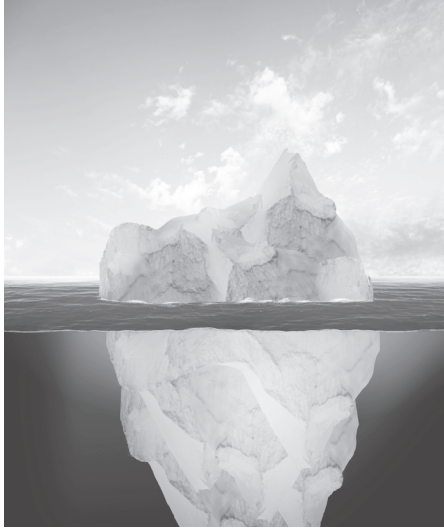
Resim - 2

İşte her şeyi bu resim açıklıyor. Meğerki denizin üzerinde keyfince yüzdüğünü sandığımız kısım, buzdağının sadece görünen yüzeyiymiş; asıl onu yüzdüren, altındaki büyük kütleymiş efendim. Bir bakar mısınız lütfen, buzdağının derinlerdeki görünmeyen büyük kütlesi nereye giderse üstteki görünen kütle de oraya gidiyor.