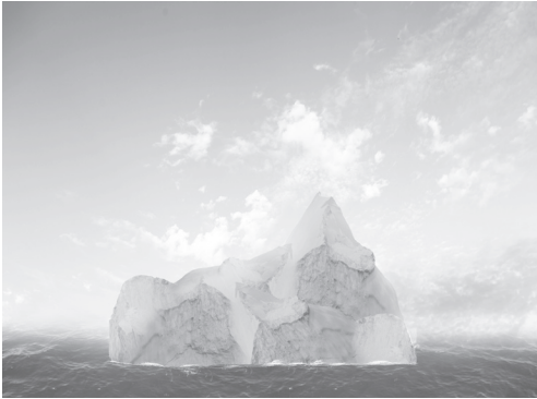
Resim - 1

Bu sorunun cevabı aşağıdaki iki resimde de açıkça görülmektedir.