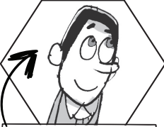
En iyi arkadaşım Batu